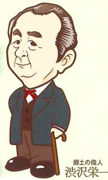
郷土の偉人 渋沢栄一